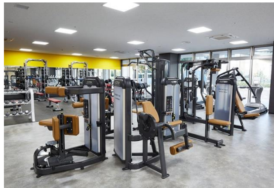
初心者でも扱いやすい 各種筋力トレーニングマシン