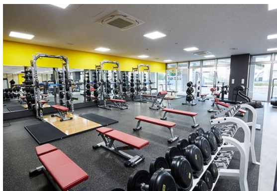
本格的トレーニングを行う方のために フリーウェイトも充実