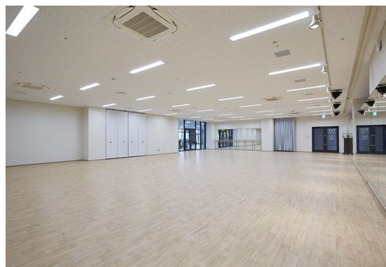
映像レッスンは自由に参加可能