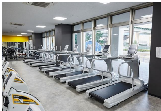
トレッドミル、フィットネスバイクなど 有酸素マシン多数